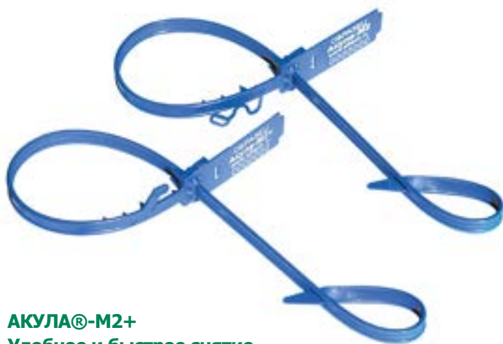
АКУЛА®-M2+ Удобное и быстрое снятие